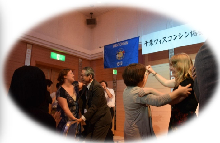
Now, let's dance !