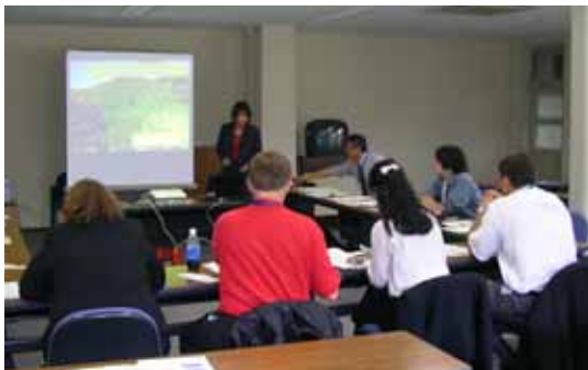
情報交換会の様子(東大生産技術研究所)