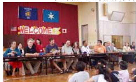
小学校での交流(館山市)