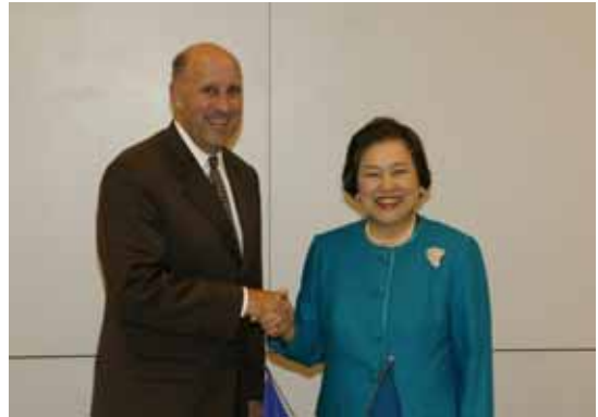
共同記者会見にて(かずさアカデミアホール)