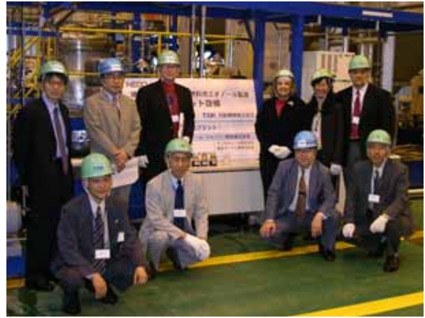
バイオマス関連施設の見学(月島機械・市川市)