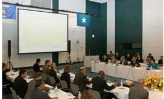
経済意見交換会の様子(同上)