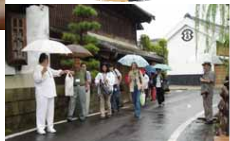
歴史的街並みを散策(佐原市)