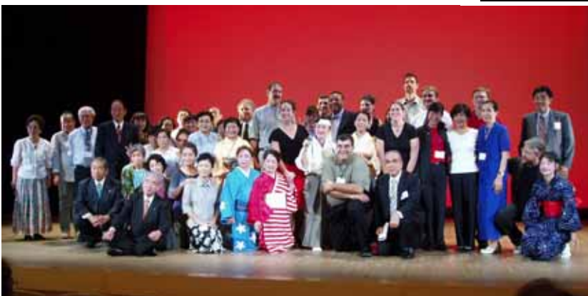
地元の皆さんと一緒に“はいっ チーズ!” (千葉県南総文化ホール)