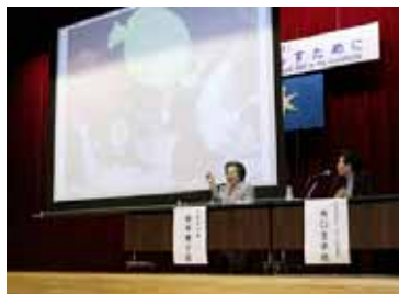
(精神保健福祉に係るフォーラム)

県では、同州との姉妹交流を「千葉ウィスコンシン協会」との連携のもと、従来の友好親善に加えて経済交流・政策交流など様々な分野に広げていきたいと考えておりますので、今後とも御理解と御協力をお願いいたします。