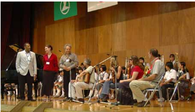
中学校での交流(富里市)

山田町にある「風土村」での交流パーティや、CWAのメインイベントでもある「ちば・ウィスコンシン交流のステージ」では、前回、使節団員としてウィスコンシン州を訪問した方々の御協力をいただき、多くの皆さんに使節団員の方々との交流を楽しんでいただきました。