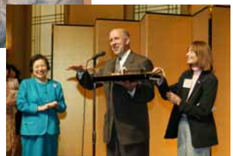
ドイル州知事夫妻と堂本知事(CWA特別顧問) (28日・歓迎レセプション)