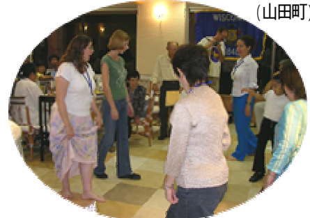
アイリッシュダンス、うまく踊れるかな? 風土村 (山田町)