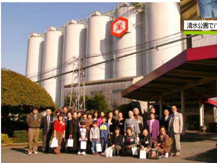
もの知りしょうゆ館にて(後ろのサイロには大豆がぎっしり...)