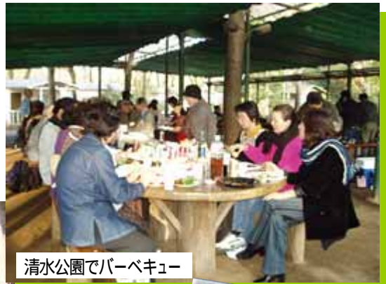
清水公園でバーベキュー

施設利用の場合は有料。「さくら名所100選」に選ばれており、ツツジや藤など四季折々の花も楽しめます。