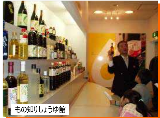
もの知りしょうゆ館