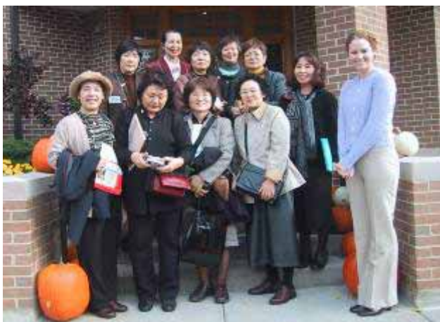
ロナルド・マクドナルド・ハウス前で