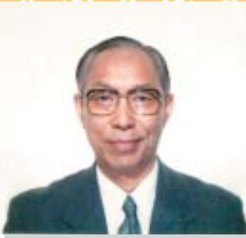
千葉ウィスコンシン協会 運営委員会アドバイザー